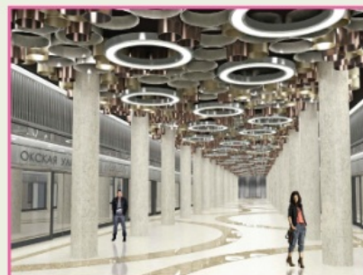
Станция «Окская улица» Расчетная загрузка: 140 тыс.чел./сутки