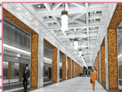
Станция «Нижегородская улица» Расчетная загрузка: 400 тыс. чел./сутки